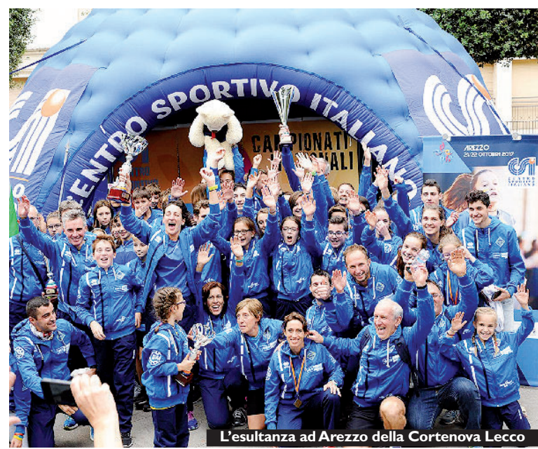
L'esultanza ad Arezzo della Cortenova Lecco