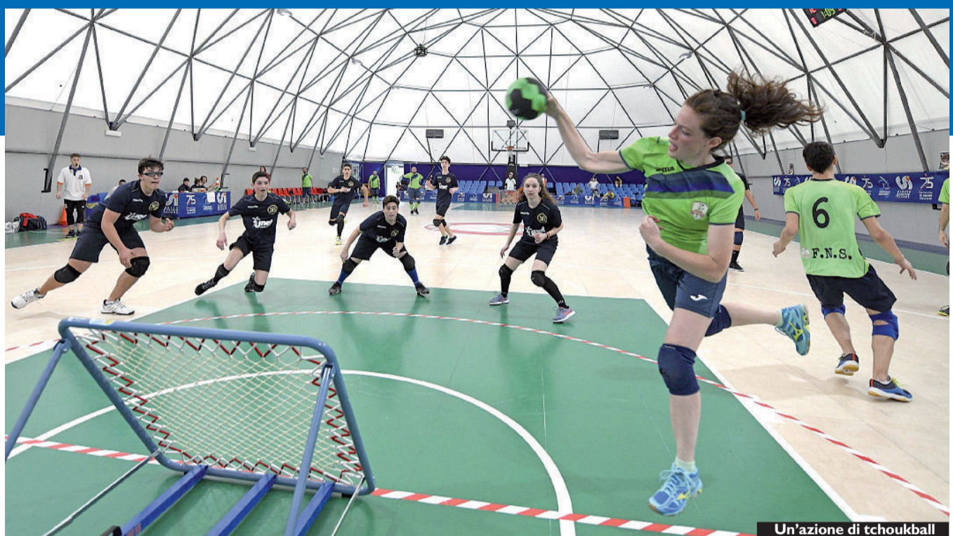
Un'azione di tchoukball