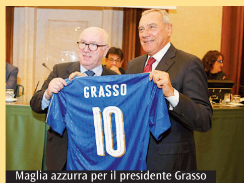
Maglia azzurra per il presidente Grasso