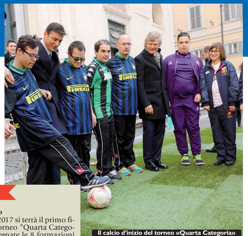
Il calcio d'inizio del torneo «Quarta Categoria»