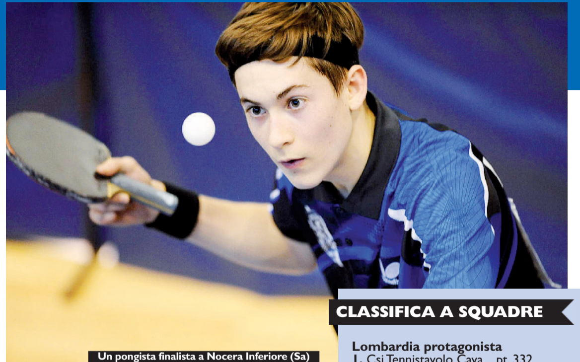
Un pongista finalista a Nocera Inferiore (Sa)