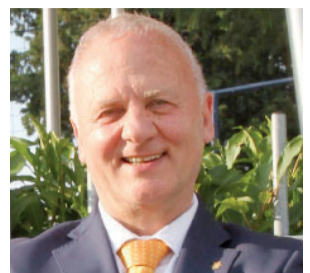
di Vittorio Bosio